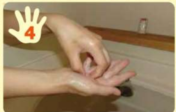
片方の手のひらに、もう片方の手の指先をこすりつけて、爪、爪と皮膚との間、指の腹を洗う。