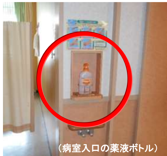
(病室入口の薬液ボトル)

各病室の前に、薬液ボトルが置いてあるのをご存知でしょうか。院内感染に最も重要なアイテム【手指消毒剤】です。当院では、ジェル状と液状の2種類のものを使用しています。病室に入る前に消毒剤で手指をしっかりと消毒して、患者さんへ外からの細菌やウイルスを持ち込ませないことが重要なポイントです。昨今は、さまざまな抗生物質の使用により、抗生物質の効きにくい、薬剤耐性菌の出現が病院内では注目されています。そのため、医療スタッフには適切な手指消毒が義務付けられています。以前の手指消毒剤は、何度も使用すると肌が荒れたり、少しの傷に沁みたりと、使用しにくいイメージでしたが、最近は保護剤を含んでおり、当院でも、手にやさしい消毒剤を使用しています。