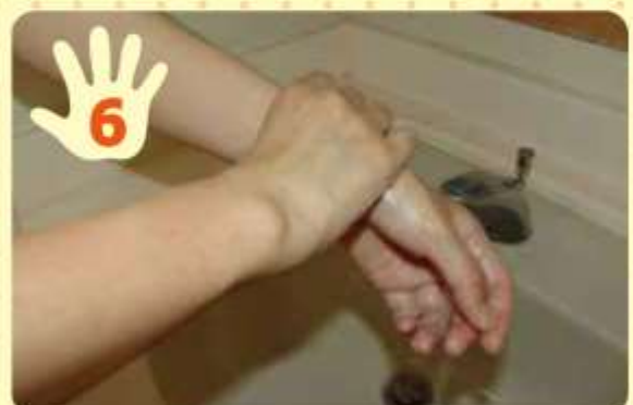
片方の手で、もう片方の手首を握り、両手を回転させて洗う。反対側も同様にして洗う。