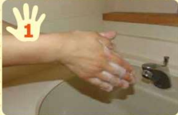
両方の手のひらをこすり合わせ、石けんを泡立てる。