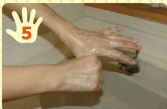
片方の親指を、もう片方の手で握り、両手を回転させて洗う。反対側も同様にして洗う。