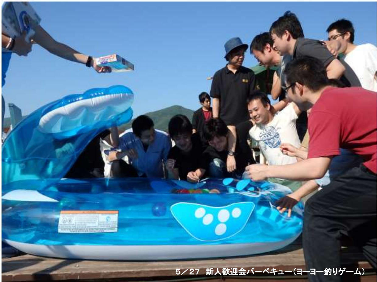
5/27 新人歓迎会バーベキュー(ヨーヨー釣りゲーム)