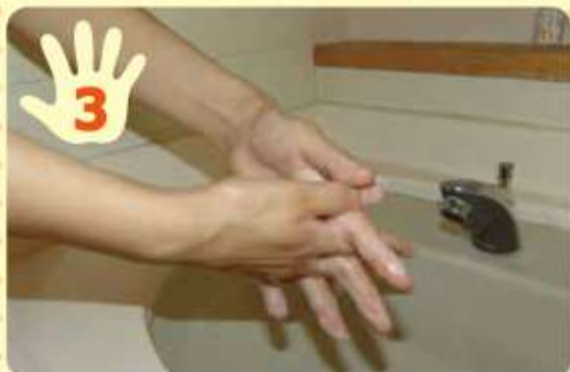
両手の指を組み合わせて、こすり合わせ、指の間を洗う。