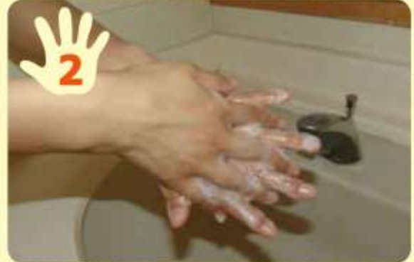
片方の手のひらで、もう片方の手の甲をこすって洗う。反対側も同様に洗う。