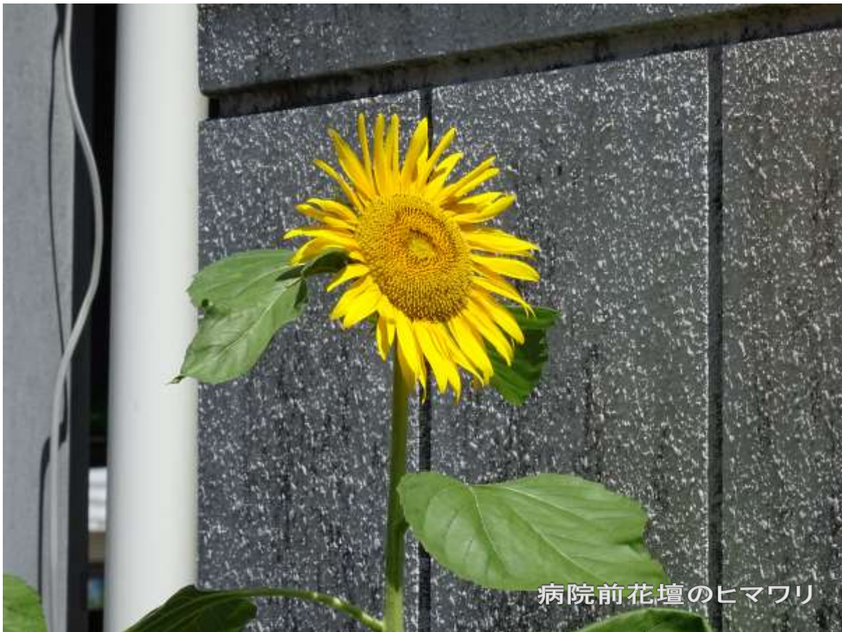
病院前花壇のヒマワリ