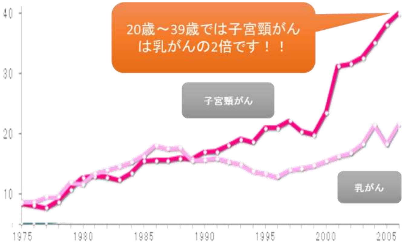
図3:20～39歳における子宮頸がんおよび乳がん罹患患者数の推移 (人口10万人あたり、上皮内癌を含む) 国立がん研究センターがん対策情報センター より