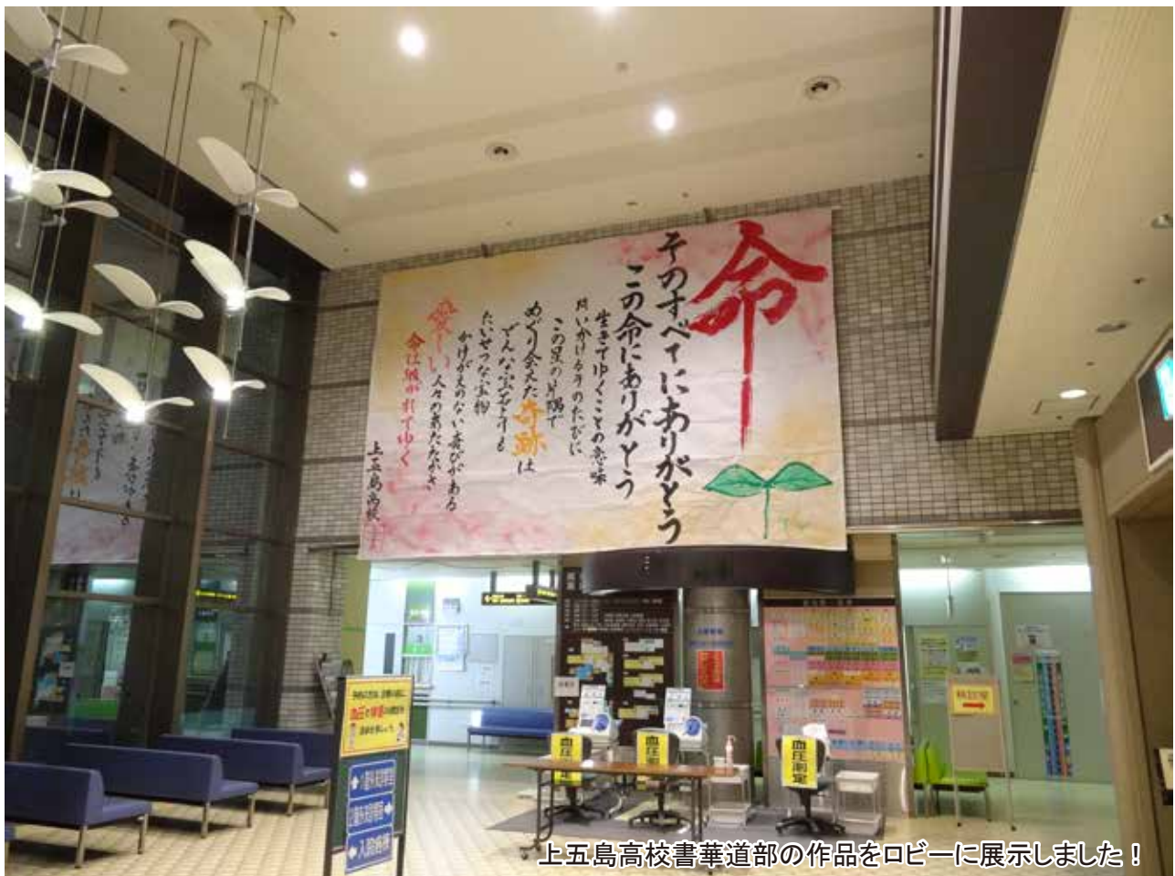
上五島高校書華道部の作品をロビーに展示しました！